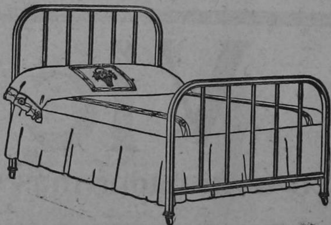
COCINAS PARA LEÑA

Tres tamaños, a precios de ocasión Almacenes al por mayor